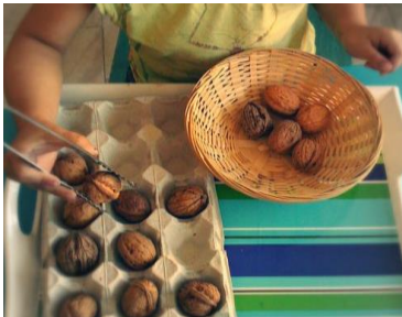
Exercer sa motricité fine